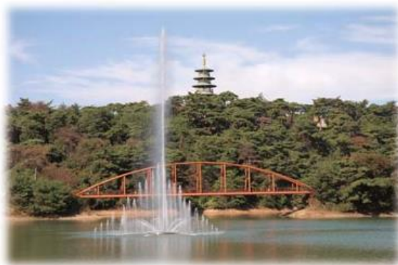
いなべ市（いなべ公園）