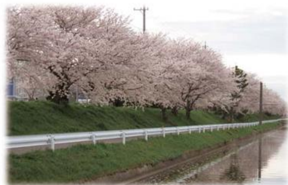
木曾岬町（鍋田川堤桜並木）